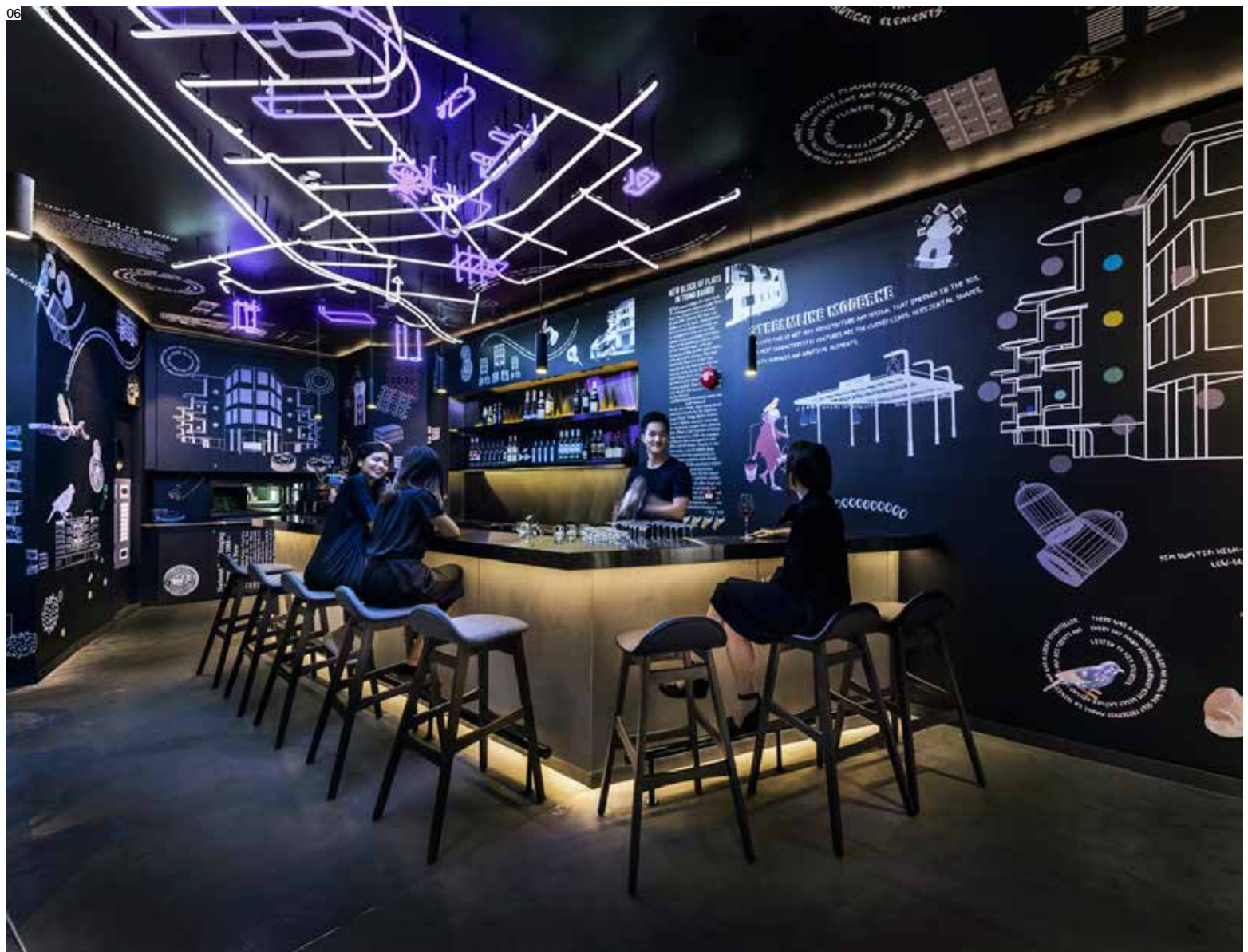
05 小餐厅高脚椅餐桌 06 小餐厅吧台