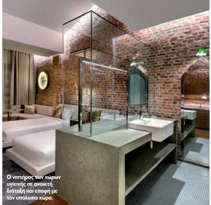
Ο νιπτήρας των χώρων υγιεινής σε ανοικτή διάταξη και επαφή με τον υπόλοιπο χώρο.

Το "boutique hotel" με την ονομασία "Loke They Kee Residences" βρίσκεται στην καρδιά της πόλης Γενάγκ, στην τοποθεσία Georgetown, η οποία αποτελεί ένα από τα πέντε μνημεία παγκόσμιας κληρονομιάς UNESCO της Μαλαισίας. Το ξενοδοχείο στεγάζεται σε τμήμα κτιρίου, που κατά το παρελθόν αποτελούνταν από ένα εστιατόριο και πέντε εμπορικά καταστήματα με ιστορία εκατό ετών, τα οποία τελούσαν υπό εγκατάλειψη τα τελευταία είκοσι χρόνια. Το κτίριο αποτελεί μέρος μιας ευρύτερης ζώνης, του Loke They Kee Heritage Village, η οποία βρίσκεται στη φάση της ανάπτυξης και της αστικής αναζωογόνησης.