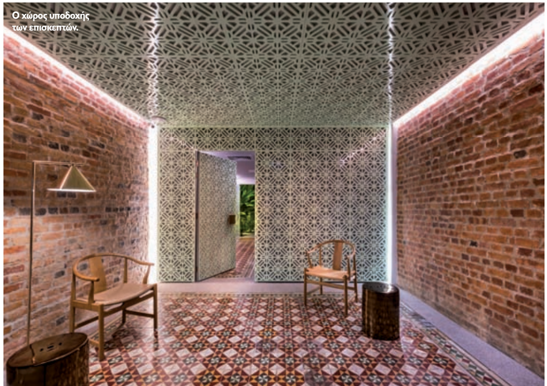
Ο χώρος υποδοχής των επισκεπτών.

ΑΡΧΙΤΕΚΤΟΝΙΚΗ ΜΕΛΕΤΗ: MOD - Ministry of Design ΣΤΑΤΙΚΗ ΜΕΛΕΤΗ: Perunding Pakatan Cergas Η/Μ ΜΕΛΕΤΗ: O&A Consult Sdn. Bhd ΚΑΛΛΙΤΕΧΝΗΣ: Ch'ng Kiah Kiean ΚΑΤΑΣΚΕΥΗ: I919 Global Sdn Bhd / SeriousBiz Sdn Bhd ΤΟΠΟΘΕΣΙΑ: Πενάγγκ, Μαλαισία ΣΥΝΟΛΙΚΟ ΚΑΘΑΡΟ ΕΜΒΑΔΟ: 633 m 2 ΔΙΑΡΚΕΙΑ ΚΑΤΑΣΚΕΥΗΣ: 2013 - 2015