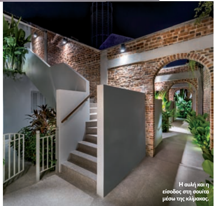
Η αυλή και η είσοδος στη σοφίτα μέσω της κλίμακας.

Η αρχιτεκτονική ομάδα ήταν υπεύθυνη και για το σχεδιασμό της ταυτότητας του ξενοδοχείου, συμπεριλαμβανομένων ενός αντισυμβατικού καταλόγου φαγητού υπό τη μορφή μαξιλαιού, ενός χάρτη με όλες τις απαραίτητες λεπτομέρειες για τα εστιατόρια και το φαγητό της περιοχής, του καταλόγου για τις υπηρεσίες δωματίων και του προγράμματος της τηλεόρασης κ.ά. Ο καλλιτέχνης Ch'ng Kiah Kiean κλήθηκε να εμπλουτίσει το εσωτερικό των σοφιών με εννέα έργα τέχνης, τα οποία αναπαριστούν γνωστά κτίρια της αρχιτεκτονικής κληρονομιάς της περιοχής. Το αποτέλεσμα και όλες οι παράμετροι του σχεδιασμού συντελούν σε μία ολιστική εμπειρία, που προσφέρεται κατά τη διαμονή στους χώρους του ξενοδοχείου.