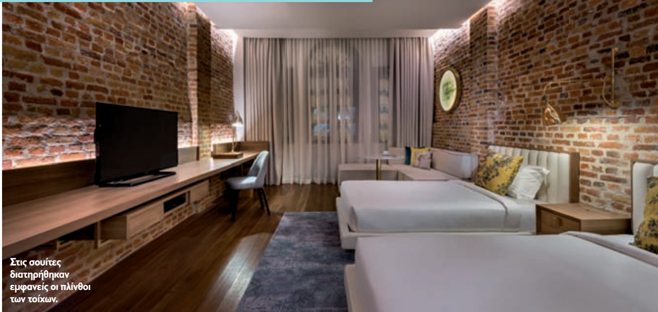
Στις σοφίτες διατηρήθηκαν εμφανείς οι πλίνθοι των τοίχων.

ειδικά διαμορφωμένα έπιπλα να δίνουν την εντύπωση ότι αιωρούνται από το επίπεδο του ορόφου. Η τραχιά υφή των υπό διατήρηση πλίνθων ζωντανεύει με τη βοήθεια λαμπτήρων φωτισμού (LED), που βρίσκονται στις ακριανές εσοχές της βαθμιδωτής οροφής. Οι κατά παράδοση μη εμφανείς χώροι των δωματίων, όπως ο νιπτήρας του χώρου υγιεινής και οι λινόθηκες αναδεικνύονται ως διαφανή γυάλινα κουτιά, που επεκτείνονται και γίνονται ενιαίο τμήμα της σοφίτας. Οι τάπητες, τα μαξιλάρια και τα έπιπλα επιλέχθηκαν με τέτοιο τρόπο, ώστε να προσδίδεται η έννοια του σύγχρονου στην παραδοσιακή υφή του κτιρίου.