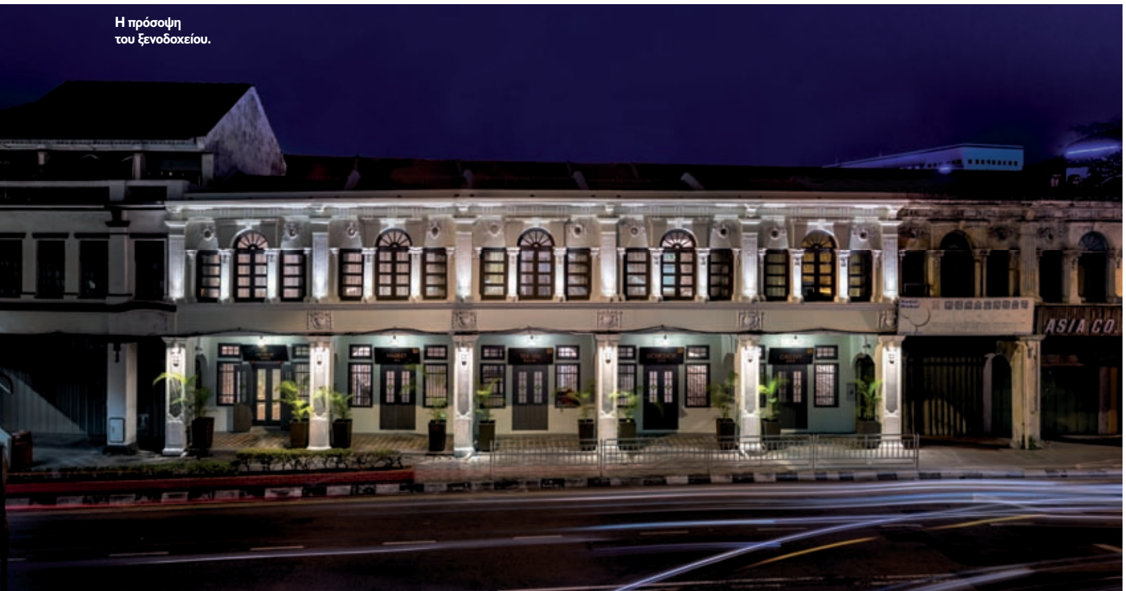
Η πρόσοψη του ξενοδοχείου.

Το παραδοσιακό συναντά το σύγχρονο σε πολλαπλά επίπεδα, από την υλικότητα μέχρι τη χωρική εμπειρία. Τα παραδοσιακά μασίφ ξύλινα δάπεδα ξεχωρίζουν με τα